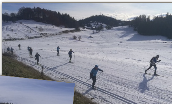
En style classique à Plaine-Joux